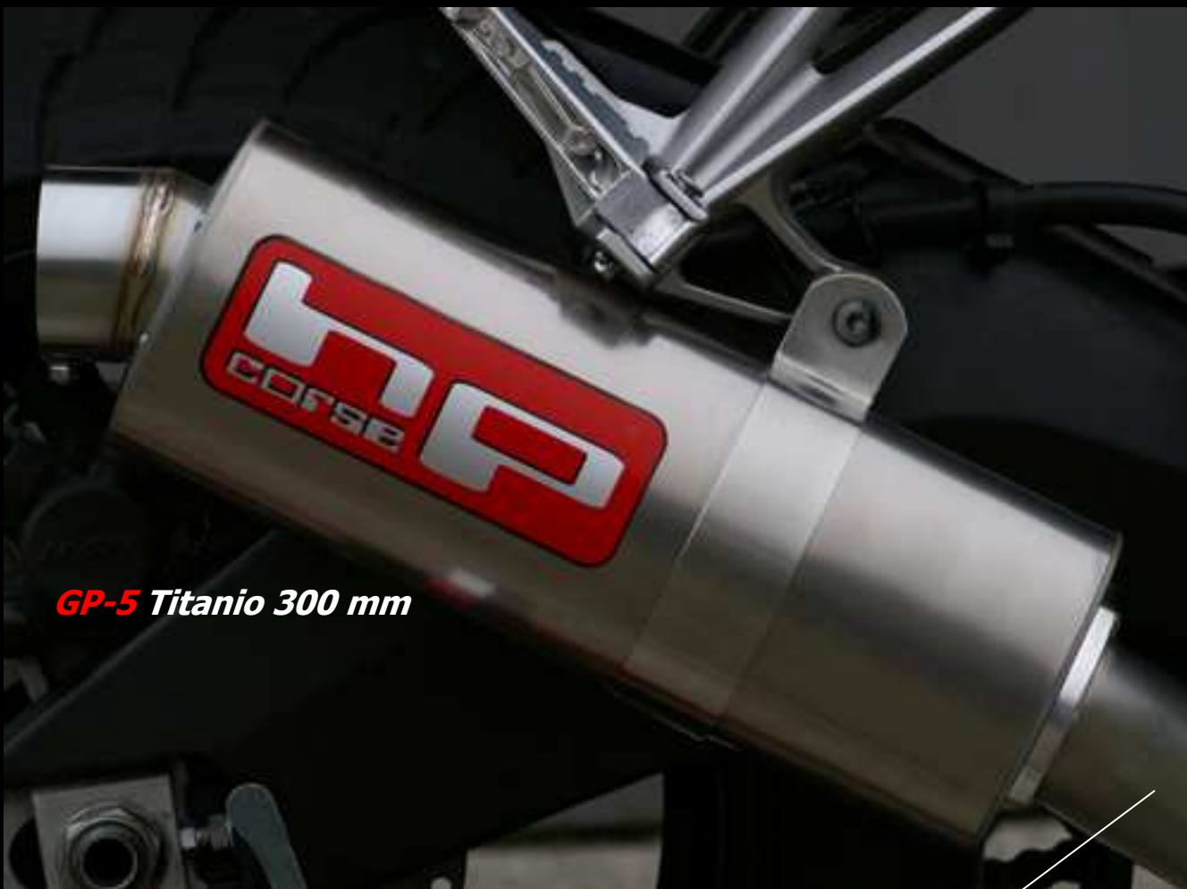
GP-5 Titanio 300 mm