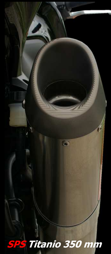
SPS Titanio 350 mm

Raccordo in acciaio inox AISI 304 diametro 60 mm