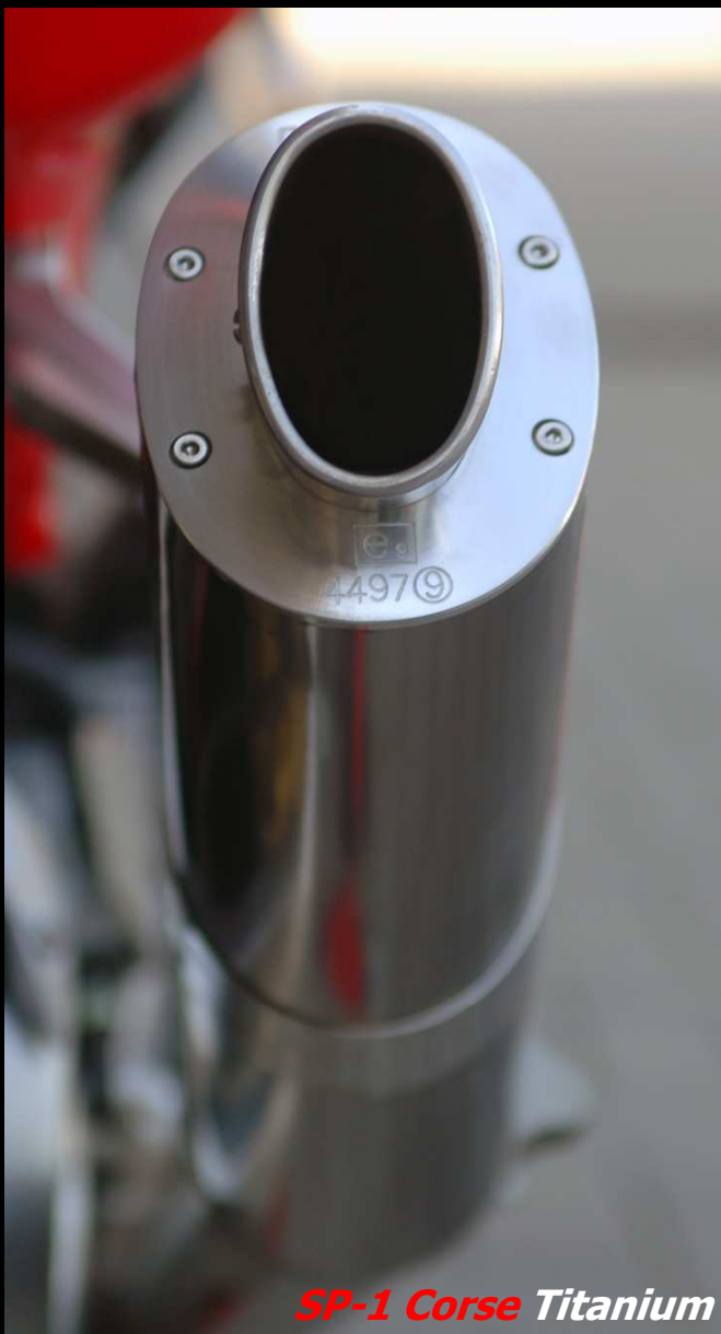
SP-1 Corse Titanium