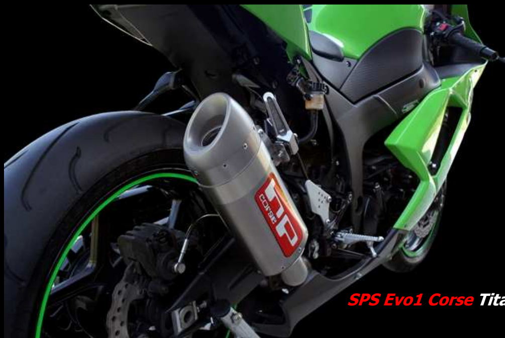
SPS Evo1 Corse Titanio