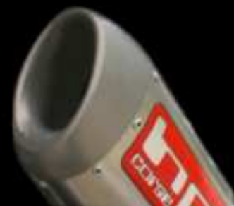
SPS ® CORSE