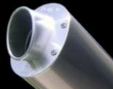
SP 01 EVO ® CORSE