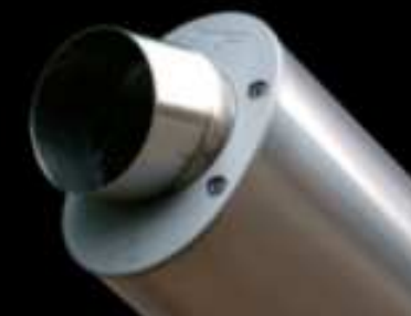
GP 05 ® CORSE