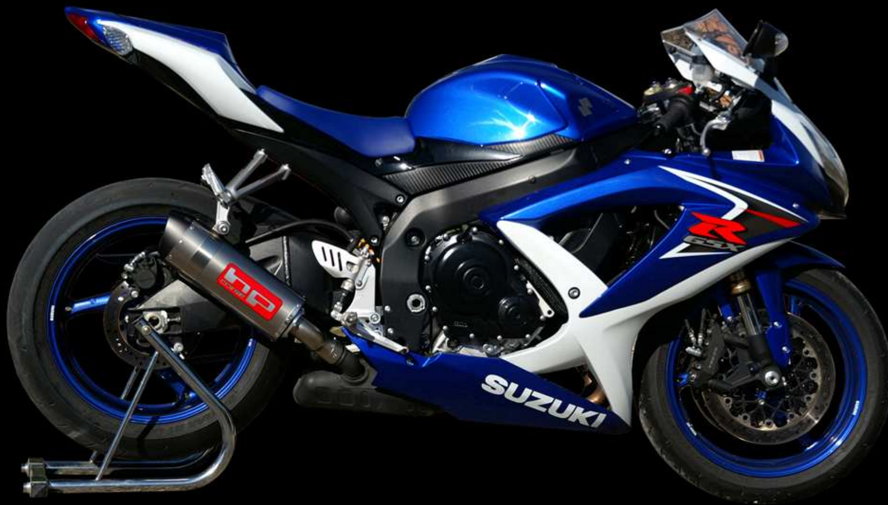
SUZUKI GSX-R 600 K8